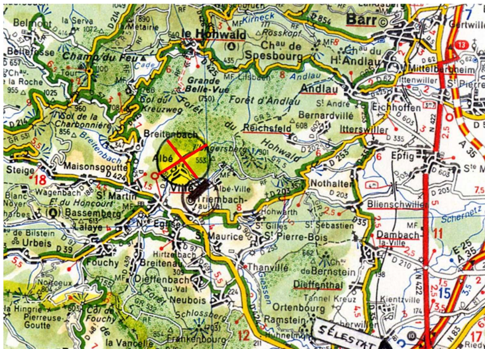
Fiche indicative—Le pilote est seul responsable—SVP signalez les modifications

PILOTES ULM: il est fortement conseillé d'avoir suivi une formation « Montagne »