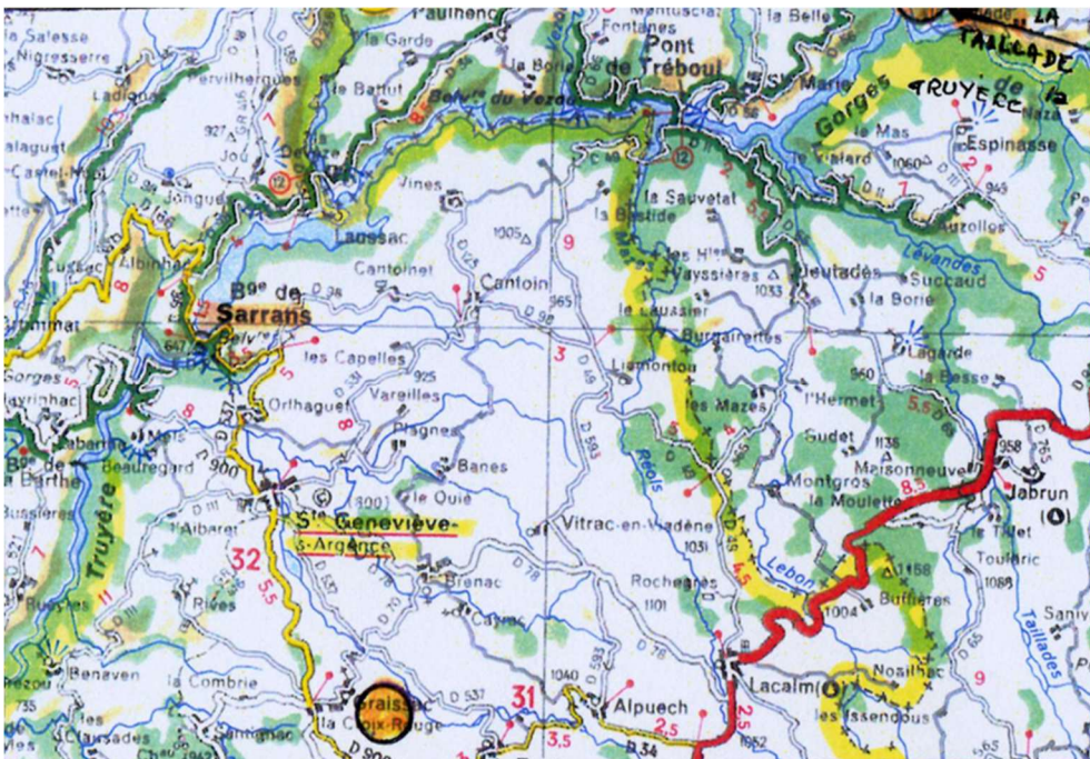
Fiche indicative—Le pilote est seul responsable—SVP signalez le modifications

PILOTES ULM: il est fortement conseillé d'avoir suivi une formation « Montagne »